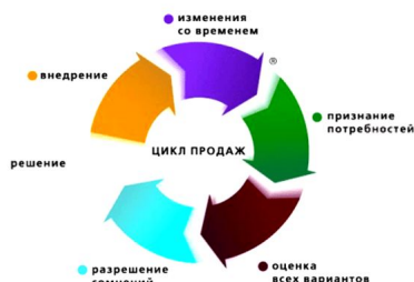
Рис. 2. Цикл принятия клиентом решения

То, что это уже ваш клиент, – слабое утешение. На практике довольно часто необходимо вновь и вновь доказывать клиенту, что вы лучшие, поскольку у него (клиента) есть свое представление о критериях выбора страховой компании (по данному конкретному риску) и предлагаемых условиях страхования.