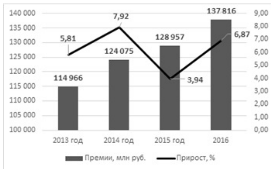
Рис. 1. Динамика премий по ДМС в 2013–2016 гг.